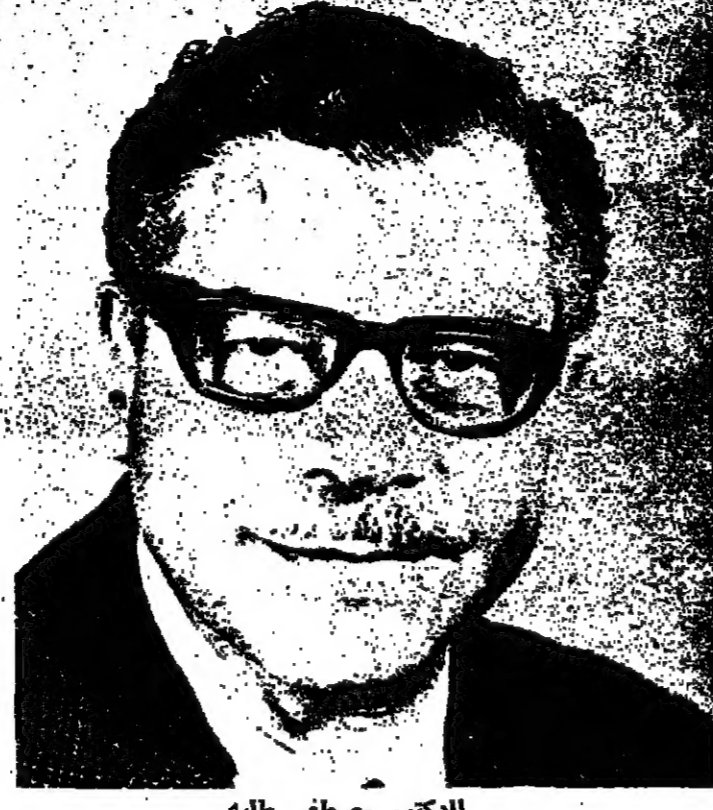
الدكتور مصطفى طلبه

التنمية المتوازنة تحول العالم الى مكان أكثر صحة وأكثر ثراء كان شعار البيئيون في البداية «تقنوا الطبيعة» ، هذه الام المقنسة ، على حد قول الشاعر الهندي طاغور .. ثم اكتشفوا ان الكائن البشري هو الحقيقة الحقيقية فاضافوا الى الشعار الاول «.. تحقوا الانسان» فانما ما استمر التلوث على ايقاعه الحالي ، لا بد ان يحدث تعديلا بنيوي في التكوين البيولوجي للانسان يعكس على قدراته العقلية بحيث يستطيع جولايسان هكسلي ان يردد بكل خيلاء ، ولو من الآخرة ، انني اول من تنبأ بالثورة المحيولة . لكن الاجور لم تصل الى هذا الحد الكارثي ، فالتلوث ، ومن بينهم الدكتور مصطفى كمال طلبة ، المدير التنفيذي لـ «برنامج الأمم المتحدة للبيئة» لا زالوا يراهنون على عمل ، على المستوى الوطني والدولي ، يتداخل فيه التخطيط المستقبلي مع مستزلمات البيئة .